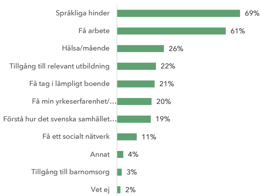
Figur 1 - Vilka är de största hindren för etablering i Sverige?

Not: Antal respondenter: 838, antal valda svar: 2 168. Frågan som ställdes var "Sedan du kom till Sverige, vad har de största utmaningarna för att etablera dig här handlat om?". Flera svarsalternativ var möjliga.