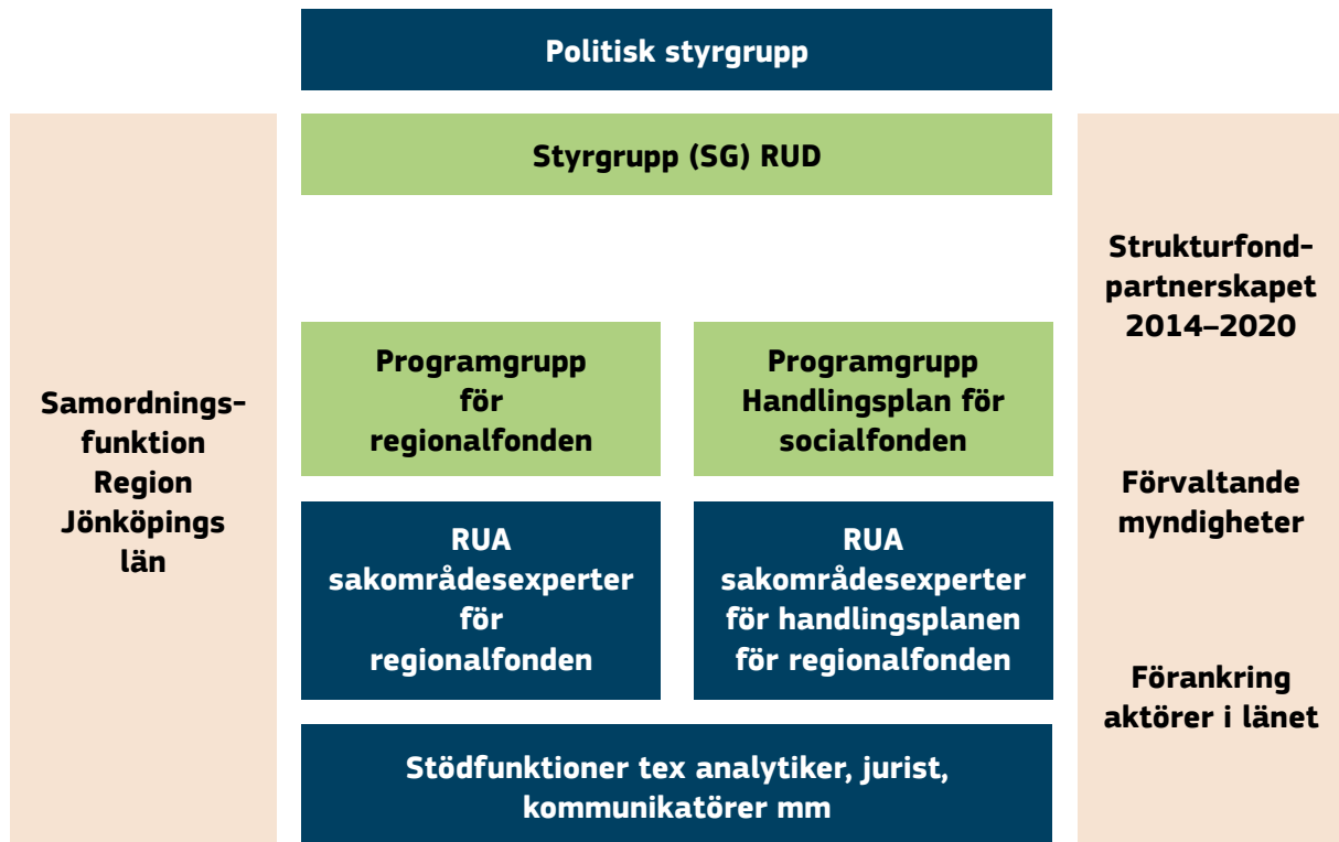
Bild över organiseringen för programarbetet i Småland och Öarna

En politisk styrgrupp har satts samman med tre politiska representanter från varje län samt ordförande för strukturfondpartnerskapet. Det finns även en styrgrupp med de fyra regionala utvecklingsdirektörerna. Det har även funnits en programgrupp med representanter från de fyra länen. Programgruppen har bestått av samma konstellation för arbetet med ESF+ och för ERUF. Programgruppen inledde sitt arbete våren 2020 och har sedan dess, med några kortare perioder som undantag, arbetat tillsammans en halvdag varannan vecka. Vid perioder av mer intensivt arbete har ytterligare arbetsmöten genomförts. Till denna programgrupp har också representant från Svenska ESF-rådet, Tillväxtverket och strukturfondpartnerskapets sekreterare adjungerats.