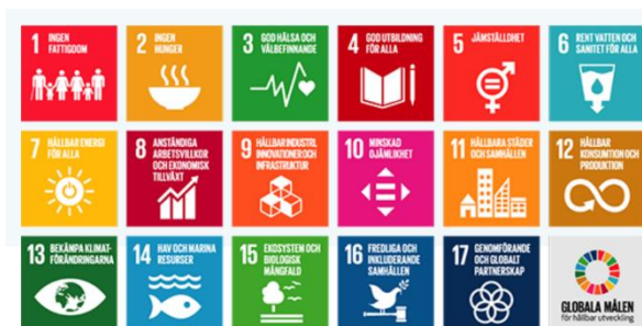
Figur 2. Agenda 2030- FN:s 17 globala hållbarhetsmål

RUFSS 2050 anger också möjligheter till samordning exempelvis med den Europeiska Regionalutvecklingsfonden (ERUF), både med det regionala operativa programmet för Stockholmsregionen och med hållbar stadsutveckling inom det nationella programmet för ERUF, liksom med det Europeiska Landsbygdsprogrammet. En samordning mellan socialfonden och exempelvis regionalfonden kräver framför allt ett aktivt och strategiskt arbetssätt av aktörerna i Stockholmsregionen. Det kan handla om satsningar på hållbar stadsutveckling där grön omställning och klimatinvesteringar är prioriterade områden för ERUF, medan inkludering och social hållbarhet ställs i fokus för socialfonden. Kompetensutveckling kopplat till smart specialisering är också ett prioriterat område för regionalfonden och därför bör om möjligt initiativ inom i fonderna samordnas. Även övrig fond- och programsamverkan kan prövas under programperioden, exempelvis med Erasmus+, Kreativa Europa samt Horisont 2020.