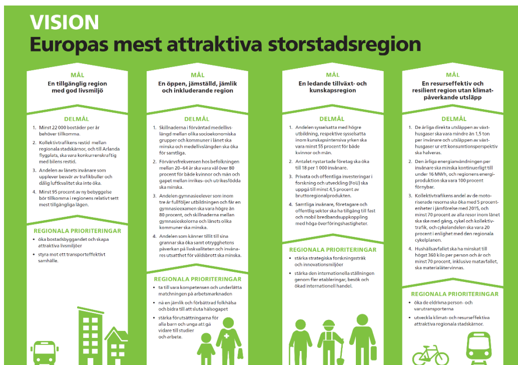
Figur 1. Handlingsplanen har sin grund i den regionala utvecklingsplanen för Stockholmsregionen RUF5 2050

En viktig utgångspunkt för RUF5 2050 är den övergripande visionen - att Stockholmsregionen år 2050 ska vara Europas mest attraktiva storstadsregion. Visionen bryts sedan ned i fyra övergripande mål som figur 1 visar.