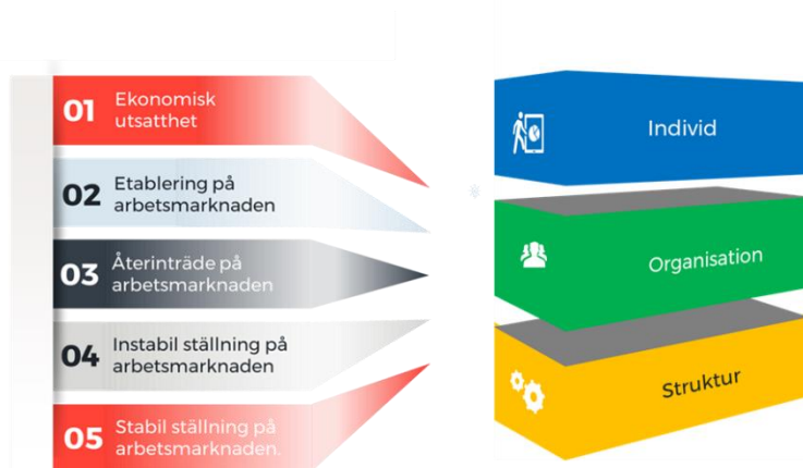
Figur 3. De fem tematiska målområdena i Europeiska Socialfonden 2021–2027

Genomförandet inom socialfonden kan i hög grad påverkas av Arbetsförmedlingens pågående reformering som bör följas så att insatser kan anpassas till kommande förändringar. En god och nära samverkan mellan Arbetsförmedlingen, kommuner, Region Stockholm och andra aktörer bedöms vara central för genomförandet.