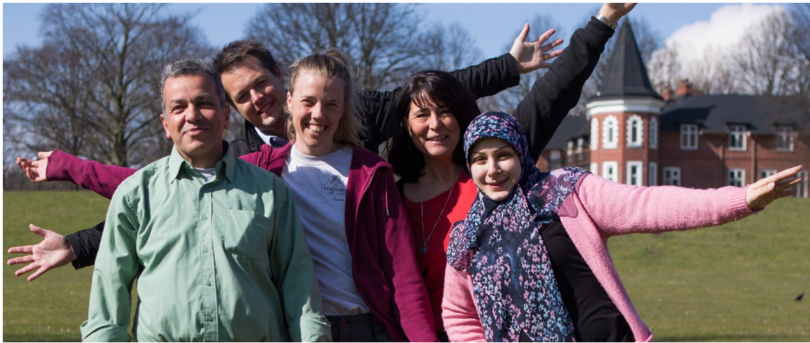
Växtplats Rosengård, ett socialfondsstött projekt som visar att kompetensutveckling, sysselsättning och integration samtidigt kan stärka ekologisk hållbarhet.

En vägledning för dig som arbetar med Europeiska socialfonden – i planering, programskrivande, genomförande, övervakning eller utvärdering på nationell, regional eller lokal nivå.