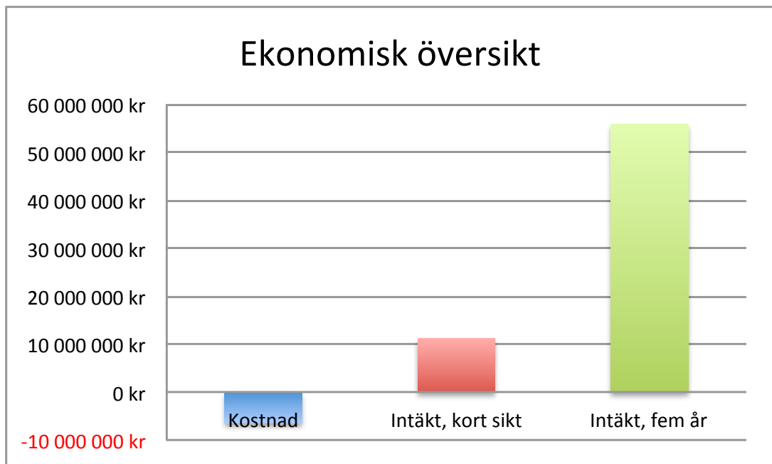
Figur 3. Figur som illustrerar projektets åtgärds kostnad samt de intäkter som projektet genererat på kort respektive medellång sikt.