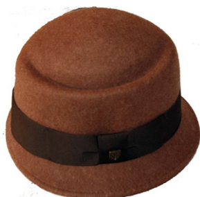
Vackra hattar fanns det också.

Seminarier som dagens är också ett forum för att driva arbetet vidare – och det behövs mycket kraft i detta eftersom utvärderingarna ska leverera "lärprodukter som driver på den regionala tillväxten och samsättningskapandet". Men kanske det t o m behövs en Lisbeth Salander för detta?